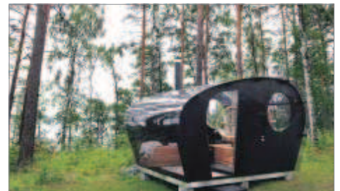
Kevytrakenteinen Olokolo-sauna sai muotonsa kotilolta.

5 Ovet ja ikkunat. Saunan ovet ovat lasia, mikä luo lisätilan tuntua ja valoa. Ikkuna ei ole välttämättä vain pieni tuuletusräppänä, vaan ikkunoita voi olla useampikin ja ne voivat olla melko isojakin.