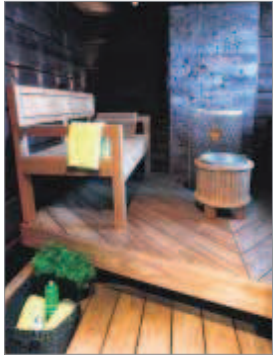
Puusepän tekemät, penkkimäiset ylälauteet. Mustiin seinii tuo eloa tehosteosio ja valoa siviikkuna.