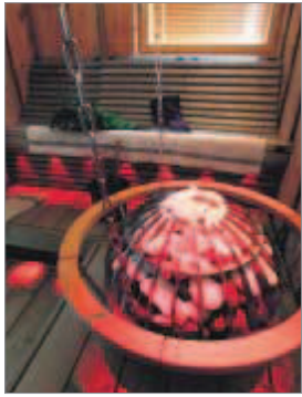
Katosta roikkuva Harvian pallokiuas, puiset riippulauteet ja väriään vaihtavat tehostevalot.