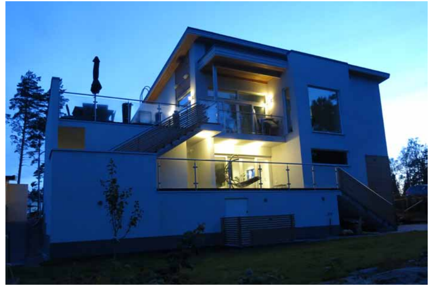
Villa Auroran suunnitteli arkkitehti Sakari Heikkinen. Talopaketti Lokka Kivitalot.