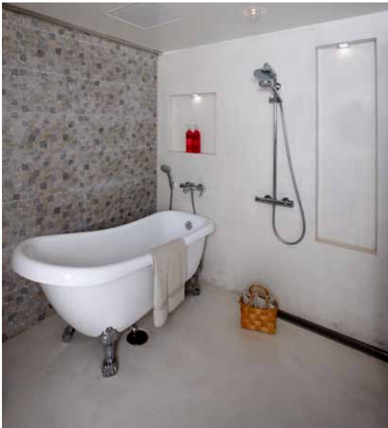
Tilavan kylpyhuoneen ehdoton luksus on valkoinen tassuamme.

ei ole meille suorittamista vaan lempeää nautintoa.