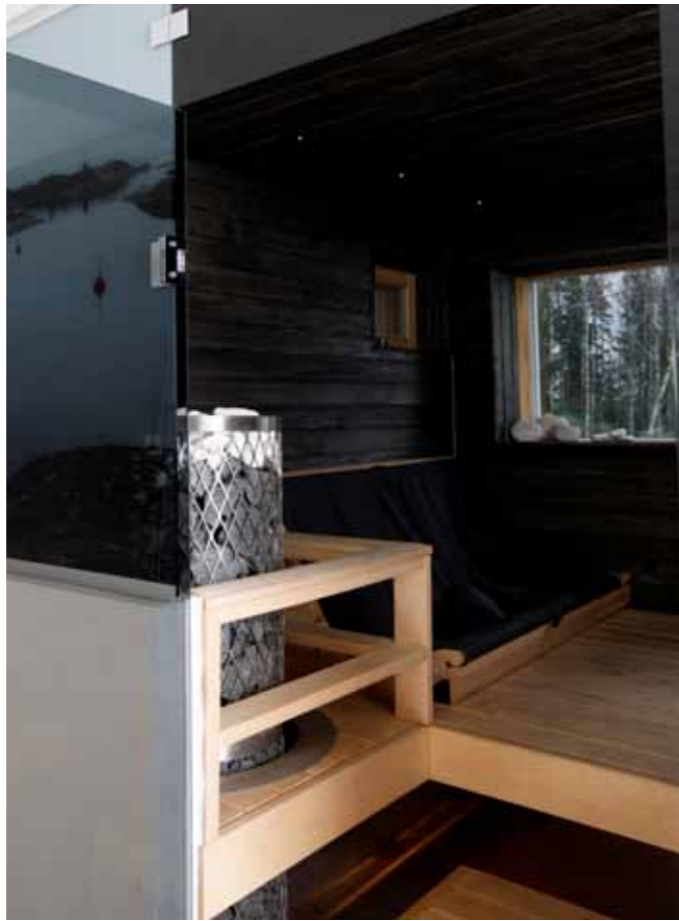
Tuhti määrä kiviä kiukaassa takaa pitkät ja makoisat löylyt.