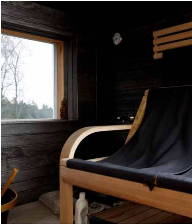
Säädettävät lauteet ovat kätevät, samoin irrotettavat istuinpäälliset.