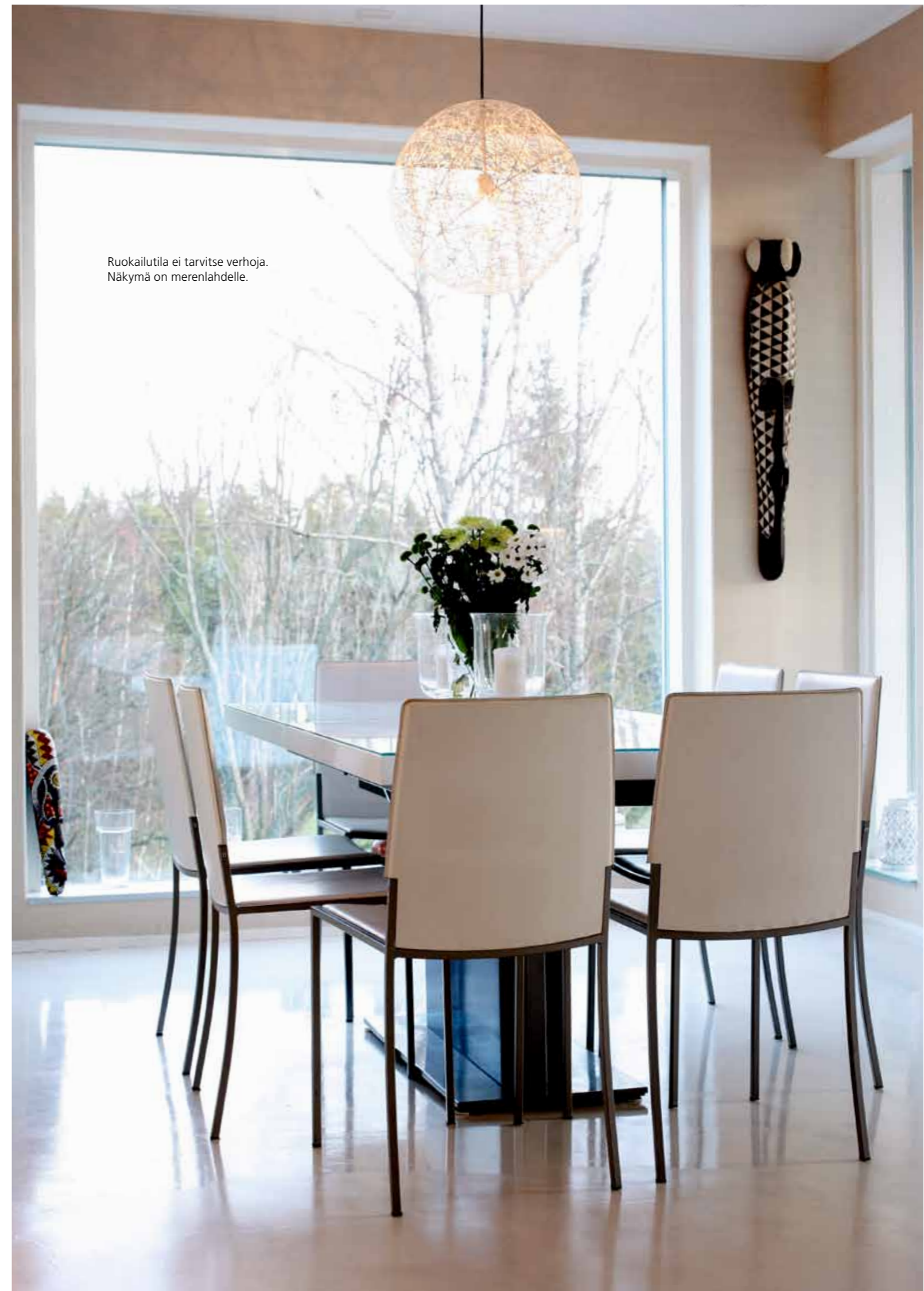
Ruokailutila ei tarvitse verhoja. Näkymä on merenlahdelle.

Joitakin ihmisiä on askarruttanut, miksi keittiö on toisessa kerroksessa. Liikuntaa harrastavalle perheelle kysymys