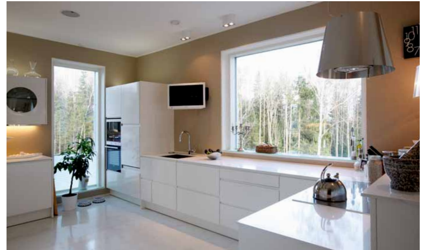
VASEMMALLA Keittiössä toistuvat olohuoneen värit: hiekka, valkoinen ja musta.