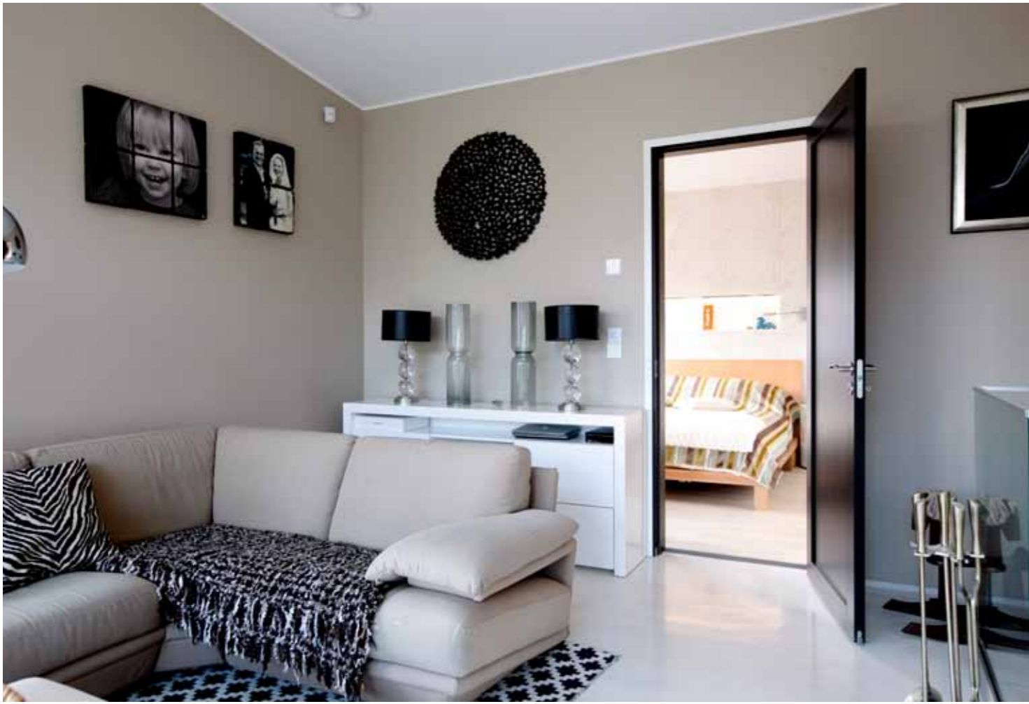
Takkatuililta on vain muutama askel vanhempien makuuhuoneeseen.